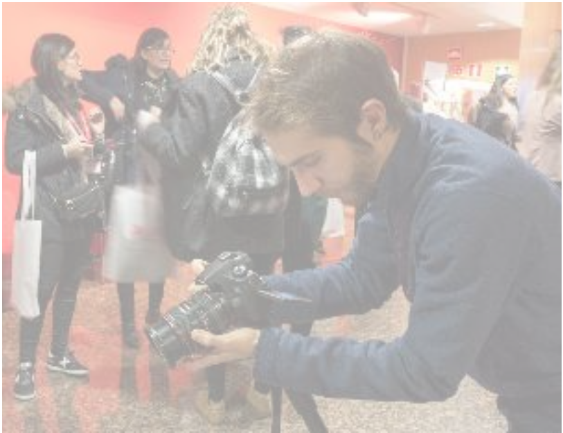
Jornada de Emprendimiento y Familia (1-12-18)

Desde Smart Mum -proyecto de apoyo al emprendimiento femenino- esperamos que este resumen te resulte útil en este bonito viaje que comienzas.